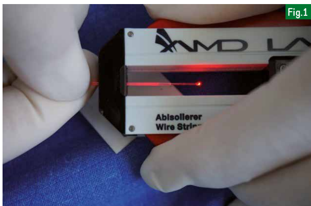
Fig.1 : L'utilisation de fibre optique de faible diamètre permet le transport du faisceau Laser.