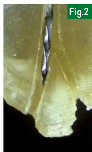
Fig.2 : La complexité du réseau canalaire, les deltas et isthmes apicaux peuvent être difficilement interprétables radiologiquement.