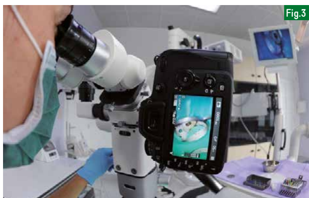
Fig.3 : La photographie couplée à la microscopie opératoire permet d'enregistrer en temps réel les informations nécessaires à la communication avec le patient.